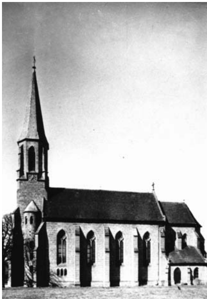
Kirche vor dem Einsturz des Glockenturms