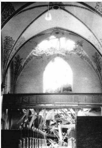
Kirche nach dem Einsturz 1959