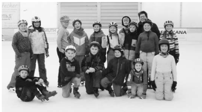
Schlittschuh fahren macht Spaß!