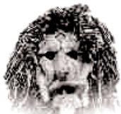
NARRENVEREIN WaldGoischerter e.V.

Auf euer Kommen freut sich die Gugge Let's Fetz Wald