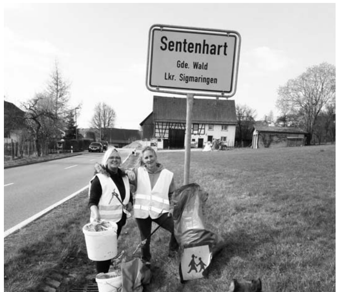
Bilder: Grün / Möhrle / Wildmann